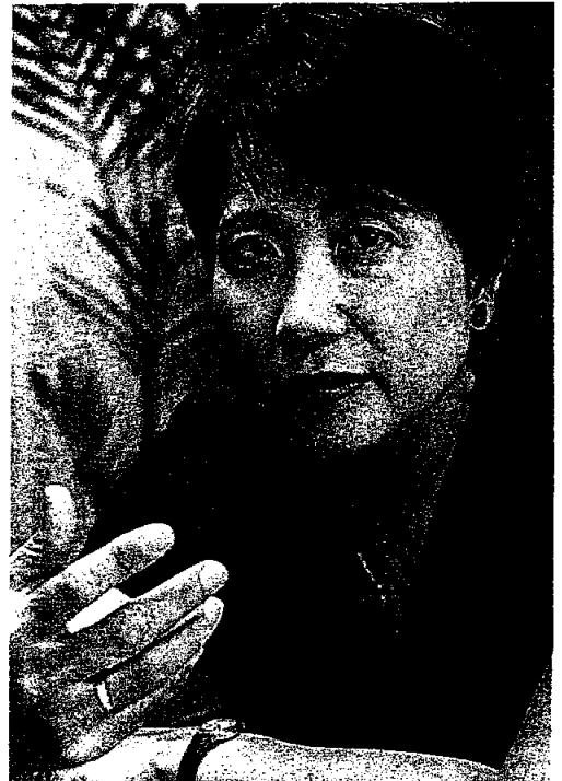
59年生まれ。81年に大蔵省(現財務省)入省。キャリア女性初の税務署長、米ハーバード大研究員などを経て、消費税導入で広報を担当。開発機関課長などを務め、06年に世銀へ。著書に「政策協調の経済学」(サントリー学芸賞)など。博士(国際協力学)

「グローバル化の時代における危機の恐ろしさを見せつけられました。先進国の金融市場を暴落させる危機が、予想されたよりもはるかに速く、また大きな規模で、途上国の实体经济に影響を与えています。世銀は、途上国の今年の成長率予測を従来の6.4%から4.6%に下方修正しました。世