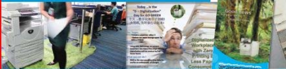
ชมวิดีโอข่าวประชาสัมพันธ์ด้านสิ่งแวดล้อม

จากภาคบริการที่ช่วยยกระดับคุณภาพชีวิตของพนักงานและองค์กร เพื่อลดภาระต่อสิ่งแวดล้อม ด้วยบริการใหม่ล่าสุดของฟูจิ ซีร็อกส์ ที่เกิดขึ้นจากสำนักงาน